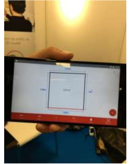
Réalisation d'un métré d'une pièce grâce à l'application MyCaptR.