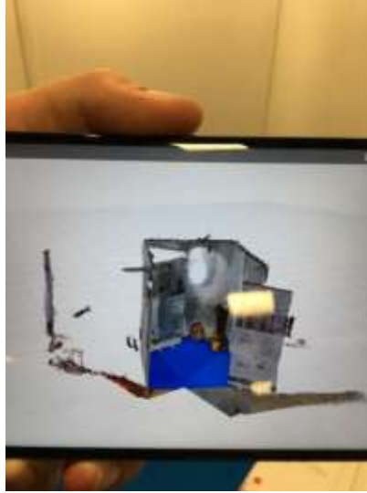
Scan d'une pièce en cours de réalisation.