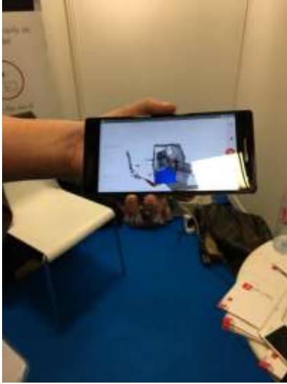
Téléphone Lenovo Phab 2 Pro (utilisé pour scanner la pièce).