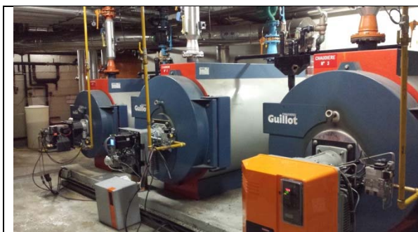
Deux chaudières de 850kW et une chaudière de 350 kW

Le chauffage de l'établissement est assuré par trois chaudières au gaz, deux fois 850 kW et 350 kW. Jusqu'à il y a deux ans, seule une chaudière de 850 kW fonctionnait ; elle suffisait pour chauffer les 38000 m 2 de l'établissement.